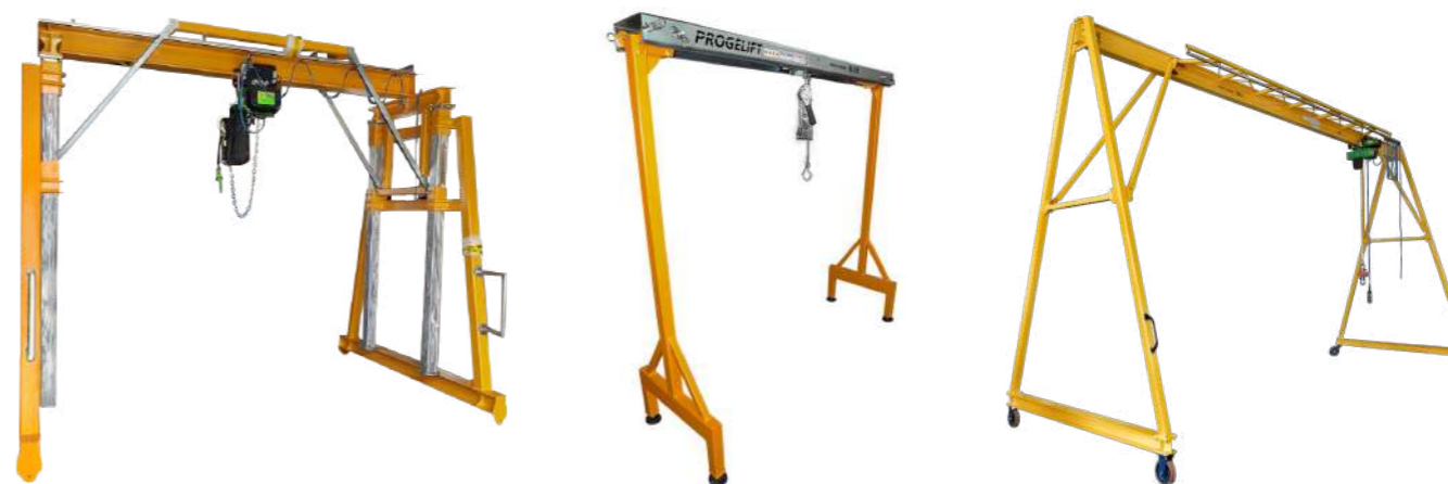
Gru a portale speciale con possibilità di aumentarne l'altezza con portata massima di TON.5 con paranco elettrico.