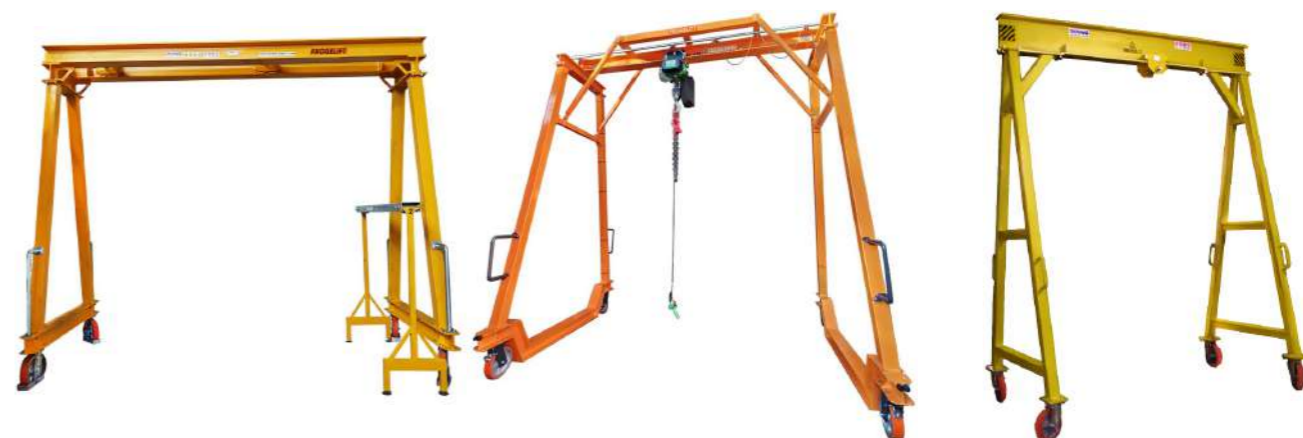
Gru a portale con doppio trave superiore e portata max TON 3.

Qua di seguito alcuni esempi di gru a portare realizzate in base a specifiche esigenze lavorative del cliente. Si tratta di attrezzature speciali realizzate su misura.